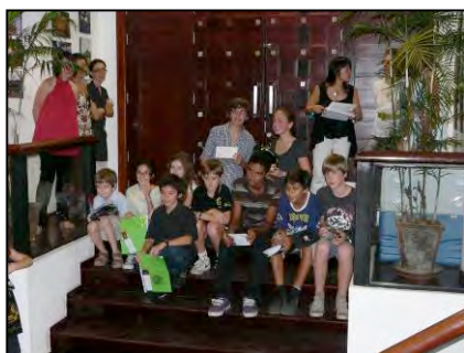
Vernissage concours 2010

Le vernissage aura lieu à L'Espace Culturel Français, le jeudi 21 avril 2011. Pensez que c'est avec vos photos que nous réaliserons le calendrier 2012 et que c'est avec le produit de la vente que nous réalisons nos plus beaux projets! Présentez vos photos aux belles couleurs et/ou aux belles lumières. Nous avons tous des portraits, des paysages, des scènes de rue, des vietnamiens au travail, dans les champs, dans les ateliers...des bateaux, des pagodes...Il est temps de faire le tri et de participer...Juste 2 clichés par personne!