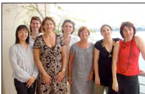
Bureau Vietnam 2010/2011