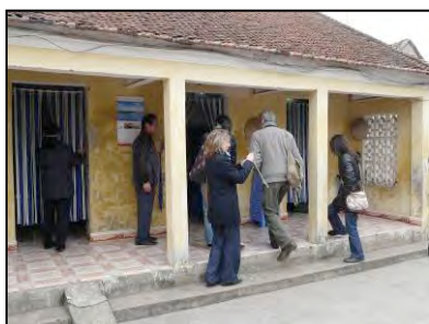
Visite à Phu Yen sur le site de la future école maternelle

La construction de deux classes de maternelle est actuellement à l'étude. Plusieurs visites ont déjà été effectuées sur les lieux. Cette école accueillera de 60 à 80 enfants de 2 à 5 ans du village, l'école la plus proche étant actuellement à plus de 9km. Le financement de cette construction devrait être couvert par un don de la société AXA présente à Hanoi.